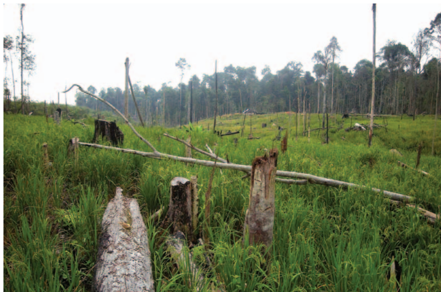
Kawasan hutan adat suku Talang Mamak di Taman Nasional Bukit Tigapuluh Riau dan Jambi

Pada saat ini, selain hutan adat di Penguatan Penyabungan, hutan adat di Sungai Tunu seluas 104.933 hektare juga porak-poranda "dilahap" pendatang dan perusahaan perkebunan sejak 2008. Hutan adat Penguatan Penyabungan yang berada di Sei Ekok hanya tersisa 4 hektare. Sedangkan hutan adat Sungai Tunu yang berada di Desa Durian